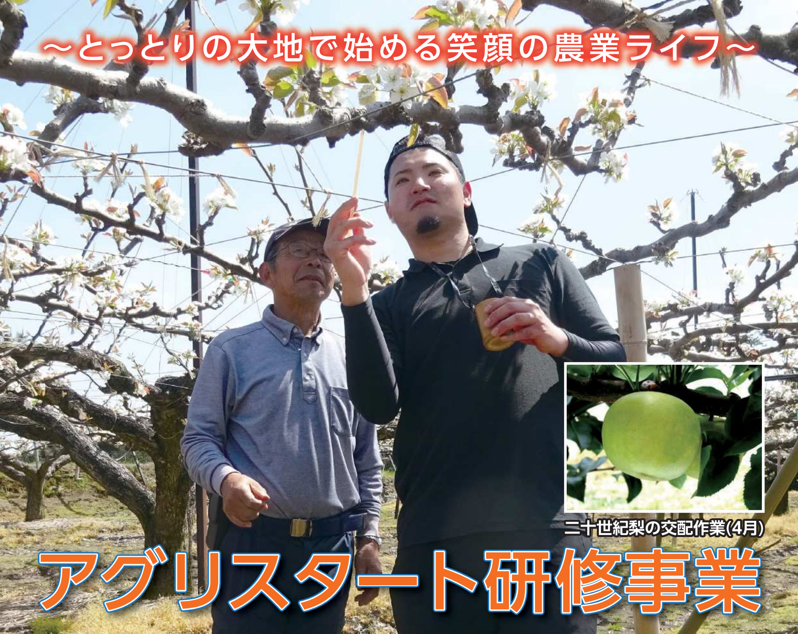
二十世紀梨の交配作業(4月)